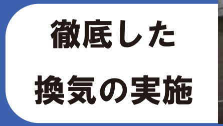
徹底した 換気の実施