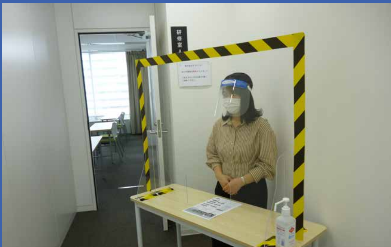
アクリル板・フェイスシールドにて受付 (東京会場のみ) (全ての会場にて)