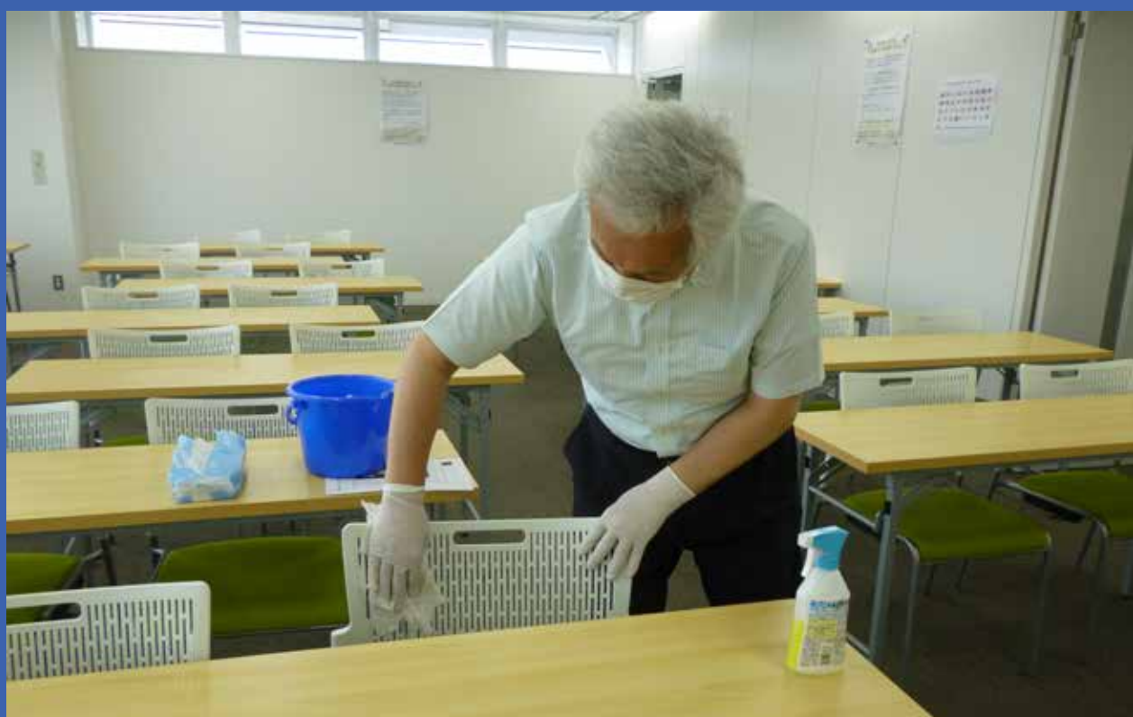
机・椅子の消毒清掃を毎日実施