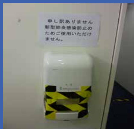
ハンドライヤー の使用禁止