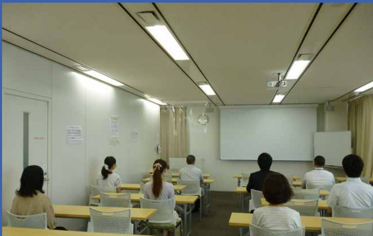
受講者同士の間隔は1m程度あけて着席