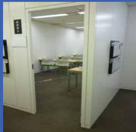
教室の扉を 常時開放